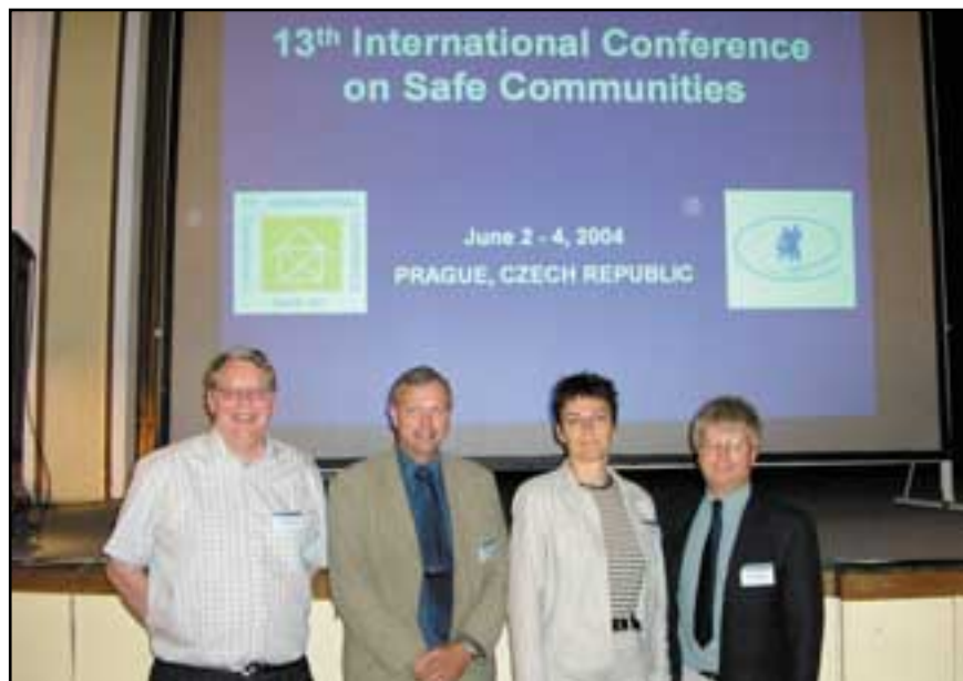
Deltagare från Töreboda kommun tillsammans med Räddningsverkets personal vid den 13:e konferensen för en Trygg och Säker Kommun i Prag.

Vårt arbete som vi här presenterar är resultatet av ett tvärsektorielt arbete. Många är idag delaktiga i arbetsgrupper eller på annat sätt engagerade i kommunens skadeförebyggande arbete.